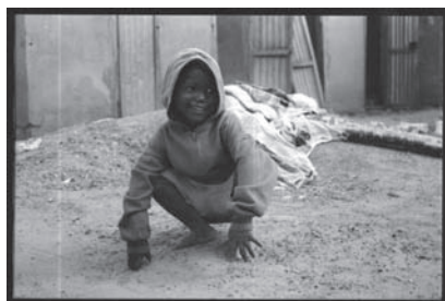
Le journal de l'association Africatilé

L'objectif d'Africatilé est d'offrir à ces orphelins une prise en charge (logement, nourriture, scolarisation, soins médicaux de base, etc.) jusqu'à la fin de leur scolarité obligatoire, puis de les orienter vers une formation qui leur permettra de sortir de l'engrenage de la pauvreté. Ils sont donc accueillis dans le centre, où l'on prend soin d'eux, puis seront placés, selon les disponibilités, dans des familles